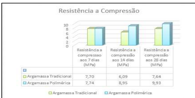
Gráfico 4: Resistência à compressão

No estado endurecido, realizou-se procedimentos de ruptura para determinação da resistência à compressão, executados conforme a NBR 13279 (ABNT, 2005). No Gráfico 4, abaixo, encontram-se os resultados médios obtidos da resistência a compressão das argamassas.