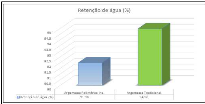
Gráfico 3: Retenção de água

Na retenção de água observa-se que o menor resultado foi obtido com o traço da argamassa industrializada polimérica, ficando evidente que a mesma conserva a água em seu interior, melhorando seu desempenho.